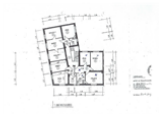
Grundriss VK 1429 GE

Kaufpreis: 63.800,00 € Wohnfläche (ca.): 58,00 m 2 Zimmer: 2,5