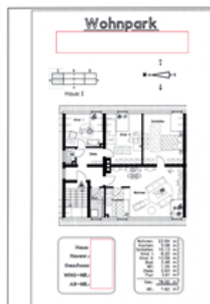
Grundriss VK 1430 BOT 1

Kaufpreis: 83.000,00 € Wohnfläche (ca.): 78,00 m 2 Zimmer: 4