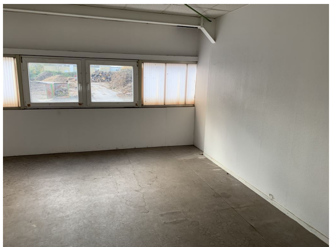
Büro 1 OG