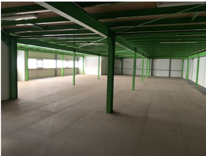
Halle 1 OG

Mietpreis pro m 2 : 2,50 € Lager-/Produktionsfläche 7.000,00 m 2 (ca.):