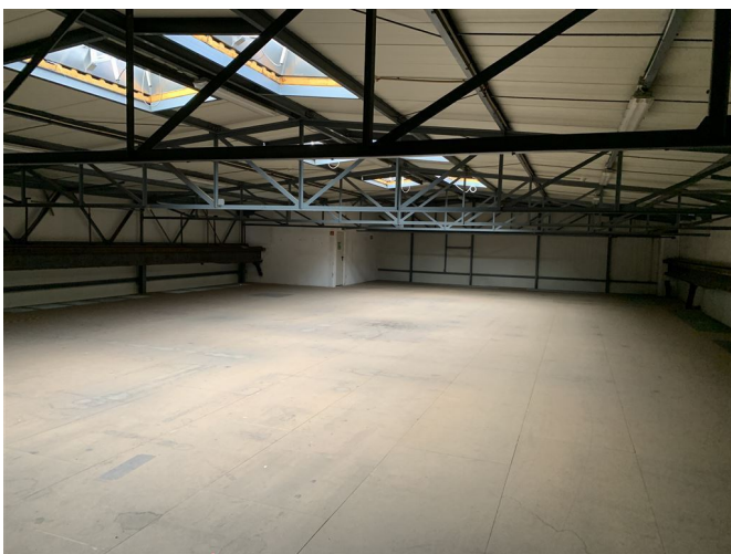
Halle 2 OG